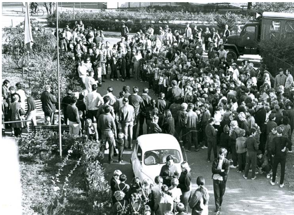
Před základní školou probíhal v prvních ročnících slavnostní nástup i vyhodnocování nejlepších. Fotografie byla pořízena v roce 1973, při 8. ročníku Mladých Běchovic.

vozu, prachu a nebezpečí byly hlavní zá- vody přeloženy mezi vily v prostoru ulice Výjezdová, Lilková, Na Spáleníšti v roce 1998 byla ve škole vyhlášena soutěž o ztvárnění loga závodu. Vítězná kresba je používána dodnes. O rok později byl na hřiště přesunut závod Běchovická míle pro starší dorostence na 1300 metrů. Několik běhů až po dorostenecké závody.